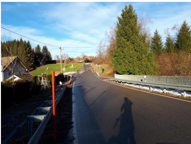
Sicherung Kreuzung – Rottachbrücke nach Wolfis durch FFW