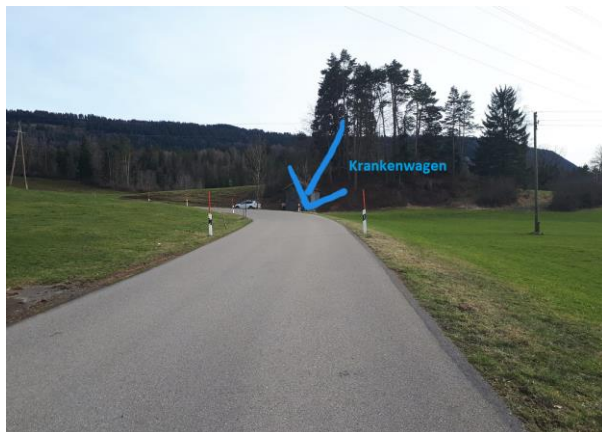
Rechts ist die Zielgerade ca. 300m nach Häusern in Richtung Wolfis. Oben ca. 100m nach dem Ziel in der Kurve der Krankenwagen