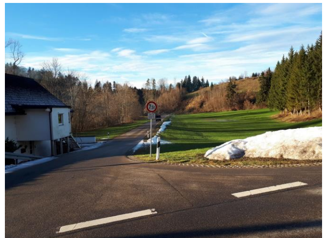
FFW leitet Verkehr blockweise nach Wolfis bergauf wenn von Häusern (gut zu sehen) keine Radler kommen.