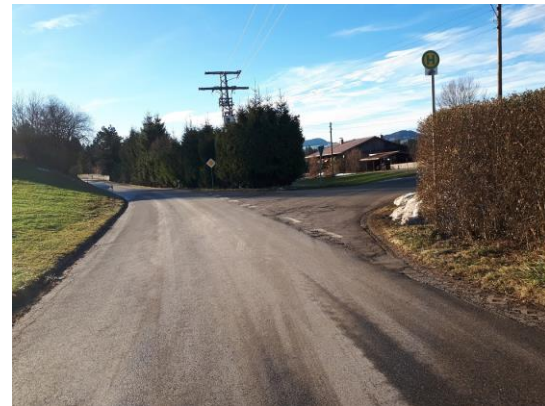
Sicherung der OA3 ab Kühbach in Richtung Wolfis durch FFW – hier Abzweigung nach Birkach