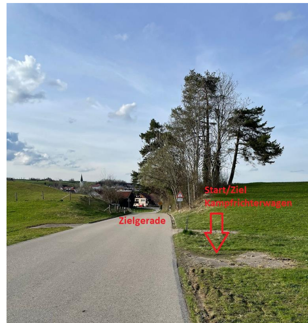
Gut einsehbar die Zielgerade leicht bergauf und ohne Gefahrenstellen. Die Kurve in Häusern ist 300m davor.