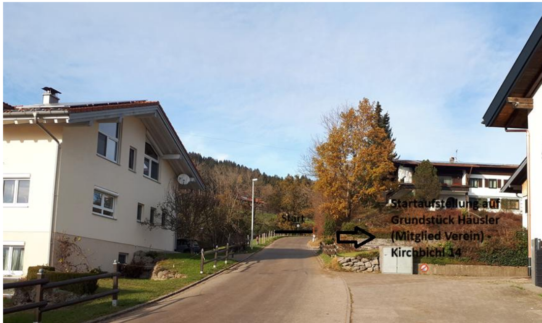
Bild 1: Start am Ende Kirchbichl. Startaufstellung bei Kirchbichl 14 (Vereinsmitglied) sodass die Straße nicht blockiert ist. Dann für 1 Minute an den Start und dann fällt der Startschuss