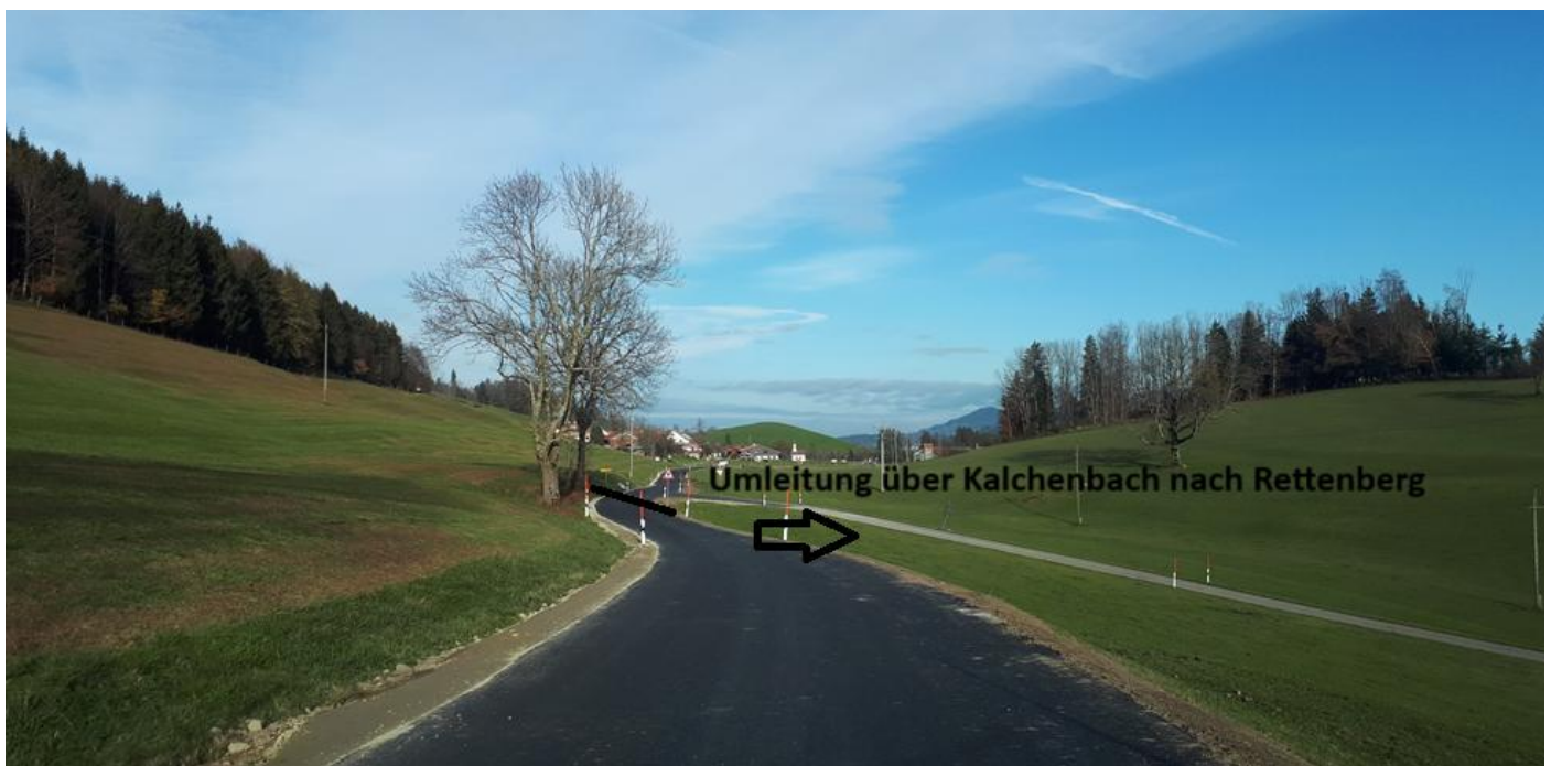
Bild 4: Umleitung für die Bewohner von Bommen/Sterklis über Kalchenbach und die Staatsstraße nach Rettenberg. Anwohner/Landwirte können nach Rücksprache mit dem Streckenposten fahren.