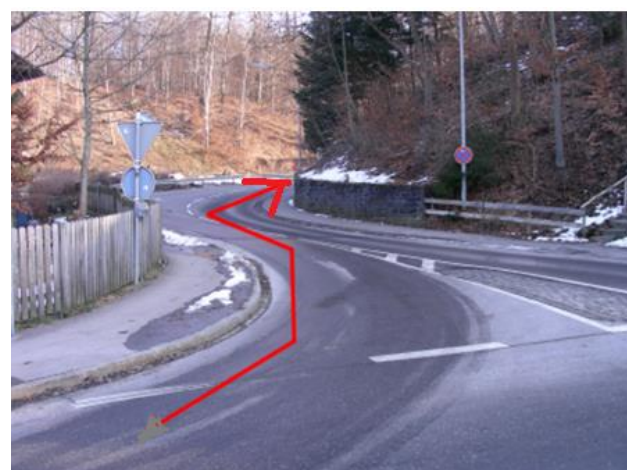
Das gelb umrahmte Schild wird mit einer Gummimatte abgedeckt. Verkehrsschild auf der Insel in der Strausbergstraße wird vorübergehend entfernt.