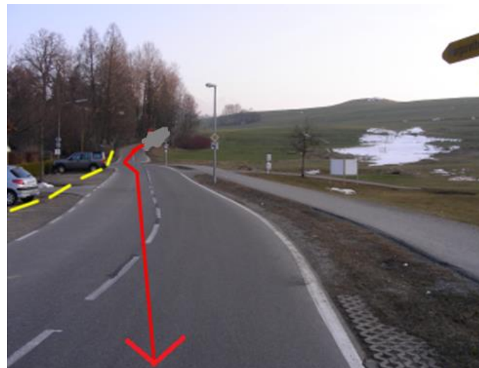
Abfahrt vom Talweg in die Strausberg Straße