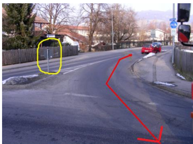
Auffahrt vom Kreisverkehr (BRK) in die Hofener Straße